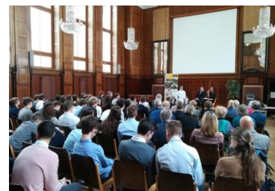
Großer Andrang und spannende Diskussionen mit dem Publikum während des Nachmittagsvortrags zum Thema Social-Media – Einsatz und Gefahren .